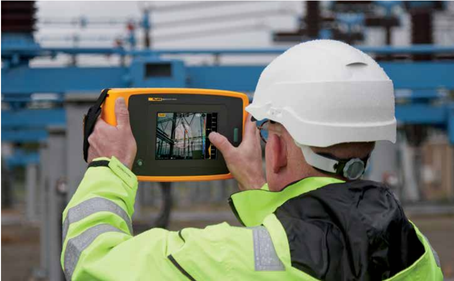
ii910 정밀 음향 이미저가 고전압 응용 프로그램에서 부분 방전을 감지하는 것을 촬영한 이미지